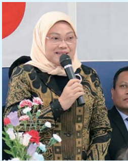
Mentenegakerja, Ida Fauziyah

Selama 30 tahun JIAEC telah menerima 15.000 orang trainee dari Indonesia. Kalian yang sedang menjalani pelatihan di Narita Training Center adalah anak-anak muda luar biasa yang telah dipilih melalui seleksi ketat dari sekian banyak anak muda di Indonesia untuk mendapatkan kesempatan berharga mengikuti pelatihan praktek kerja di Jepang. Hal ini pasti merupakan kebanggaan dan kebahagiaan bagi para trainee dan keluarganya. Kebanggaan ini tentu saja harus dihargai dengan menjaga kepercayaan yang telah diberikan oleh perusahaan penerima.